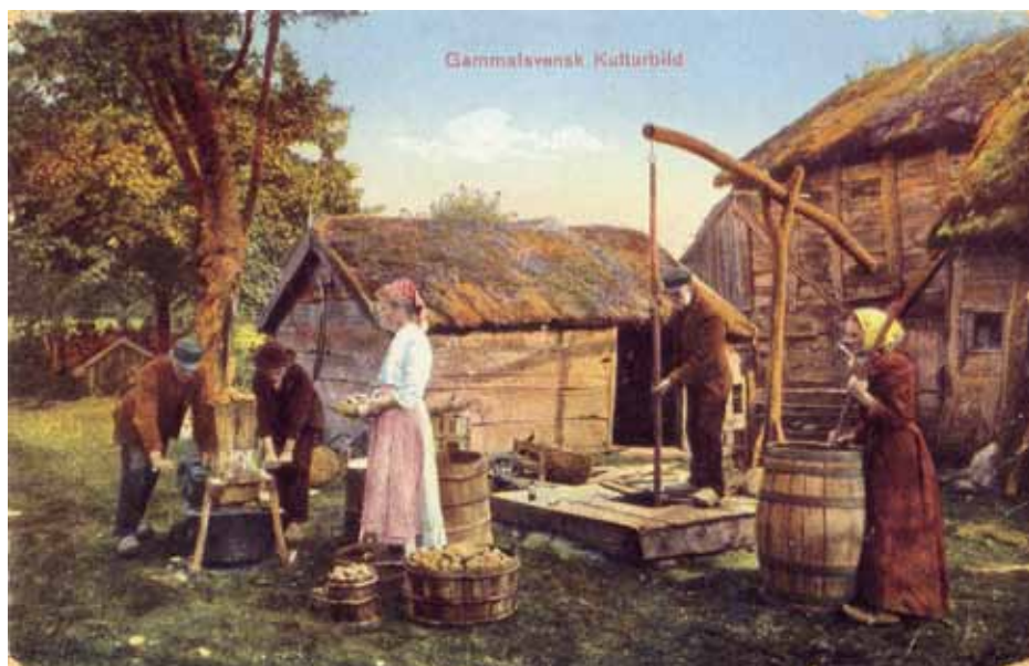
»Gammalsvensk Kulturbild» från Hudene i Gäsene härad, 1903.

Förklara den för en nybörjare, den som kan!